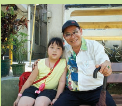
八和會員小雲龍與孫女合照