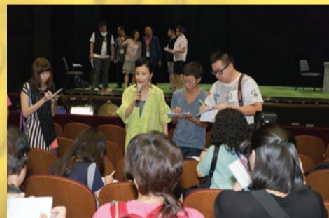
汪明荃主席於戲院中接受記者有關「粵劇新秀演出系列」的提問