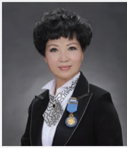
藝術總監尹飛燕女士

「粵劇新秀演出系列」是八和在粵劇承傳工作方面十分重要的計劃，在多位藝術總監的帶領下，將粵劇這門博大精深的表演藝術有系統地傳授予新秀演員，演員人數亦由開始時的46位增加至現時82位。除李奇峰、阮兆輝、羅家英、新劍郎、龍貫天外，粵劇名伶尹飛燕女士亦加入成為本計劃的藝術總監，在2013年6月至2014年1月期間，將於二級歷史建築油麻地戲院上演100場由新秀演員擔演的粵劇演出。