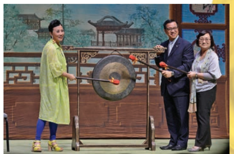
汪明荃主席、粵劇發展基金顧問委員會主席楊偉誠先生及康樂及文化事務署助理署長(演藝)周蕙心女士一同主持開鑼儀式