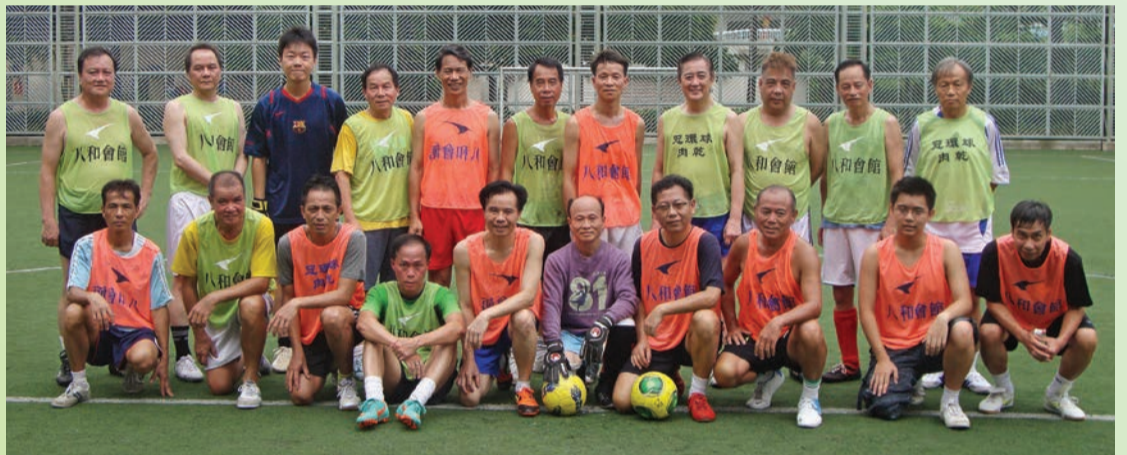
6月24日對賽練習後，八和足球隊大合照

4月9日、4月18日、5月8日、5月16日 5月28日、6月6日、6月16日、6月24日 (油麻地櫻桃街公園草場) 4月22日(石硤尾公園草地足球場)