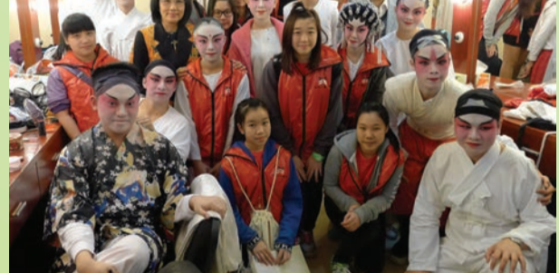
香港八和會館主席汪明荃與八和粵劇學院青少年粵劇演員班導師及學員於後台合照