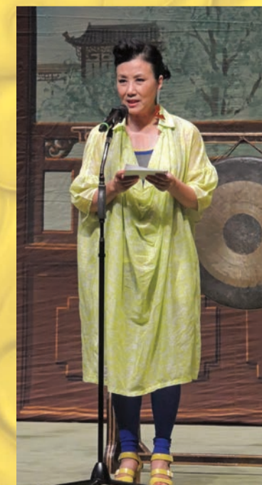
汪明荃主席在晚上舉行的開幕禮上致歡迎辭