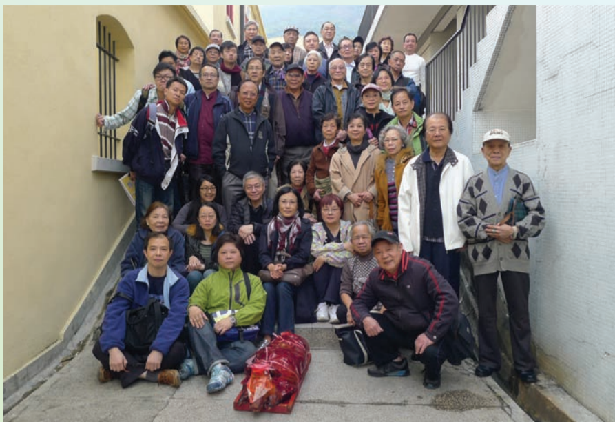
完成春祭後，汪明荃主席與全體八和會員合照