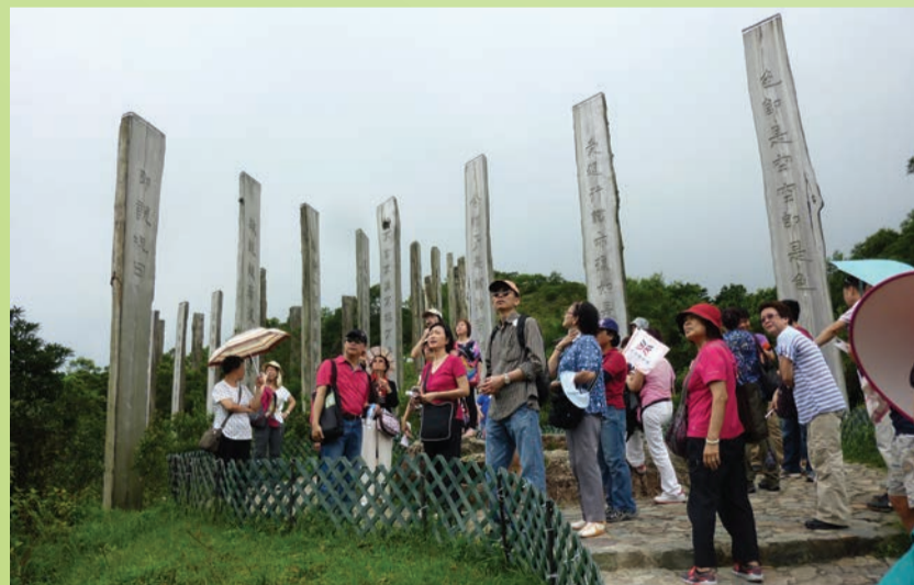
到達「心經簡林」, 各人都停下來感受當地的氛圍