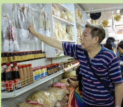
會員親屬亦拿起店內的乾貨觀看, 看似甚有興趣