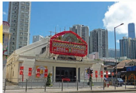
「粵劇新秀演出系列」6月4日吉時開幕禮，油麻地戲院佈置準備完成，迎接開幕禮