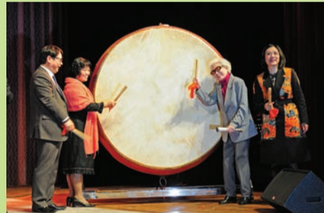
紅線女女士、香港八和會館主席汪明荃、廣東省文化廳副廳長陳杭女士、中聯辦文宣部副部長周愛國先生擊鼓為演出揭開序幕