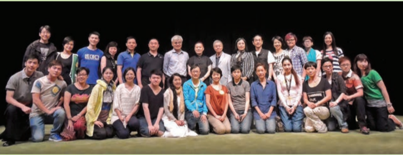
工作坊完結後全體合照(周嘉儀攝)