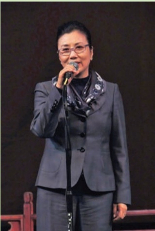
主席汪明荃致辭，感謝各界支持