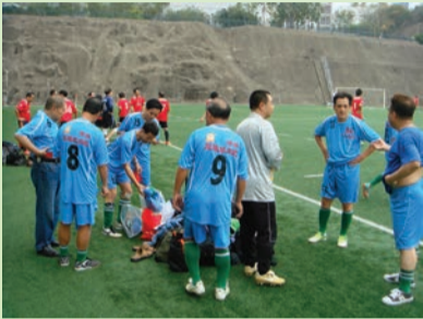
中場休息，各八和球員都不忘商討對策