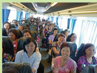
由油麻地平安大廈上車出發, 各人都非常雀躍