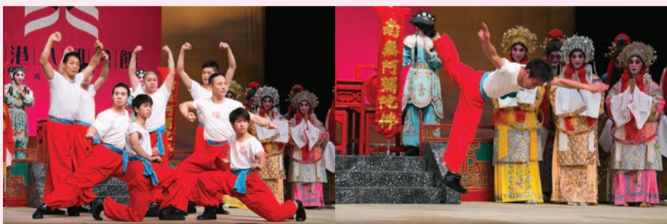
十八變 鑾興堂武師