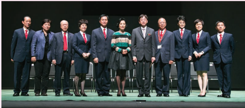
主席汪明荃、主禮嘉賓食物及衛生局局長高永文及一眾理事合照