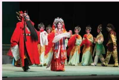
演出後向觀眾謝幕