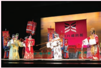
董永與七仙女離別