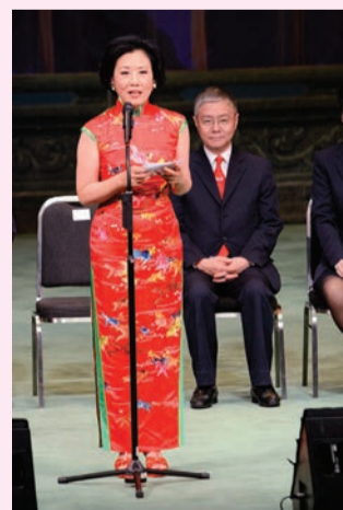
汪主席為演出致辭