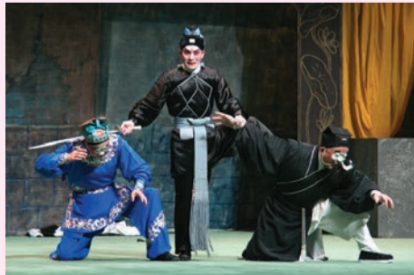
林冲怒擒高朋及陸謙