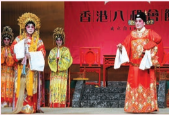
董永與七仙女重逢