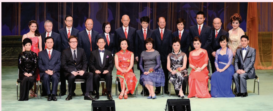
汪主席與善長、表演嘉賓及八和理事們合照