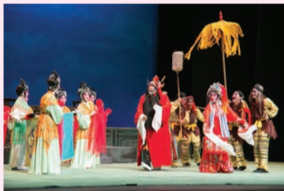
鍾馗帶同小鬼迎接喜鵲送嫁