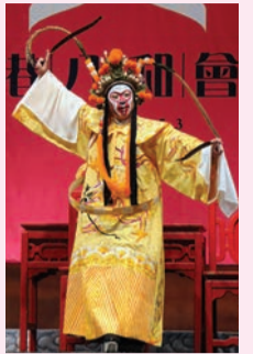
花果山 劍麟(孫悟空)