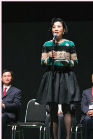
主席汪明荃為籌款演出致辭

香港八和會館為籌募經費推行粵劇承傳計劃的多項工作，在業界全人的鼎力支持下，於10月22 - 24日期間假座香港文化中心大劇院舉行連續三晚「2012籌款演出」。三晚的節目各具特色，10月22日折子戲《山神廟》、《金蓮戲叔》、《鍾道嫁妹·引福歸堂》、《去國歸降》；10月23日的長劇《帝女花》；10月24日的粵曲演唱會。粵劇界的巨星雲集，合力演出為八和會館為籌募經費，包括：王超群、尤聲普、任冰兒、李龍、吳仟峰、阮兆輝、林錦堂、南鳳、陳寶珠、陳詠儀、陳好逖、梁兆明、麥文潔、梅雪詩、溫玉瑜、廖國森、劉惠鳴、鄧美玲、龍貫天、衛駿輝、謝雪心、羅家英等。其中10月22日的折子戲門票售罄後仍不斷接獲公眾查詢，希望購買門票；經本會商議後於2012年10月15日加設開售三樓門票。是次籌款得到業界及有心人士的慷慨解囊和鼎力支持，籌得善款超過港幣二百四十萬元，支援今後發展八和會務及推行粵劇承傳計劃等工作。