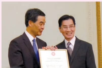
副主席新劍郎獲頒「行政長官社會服務獎狀」