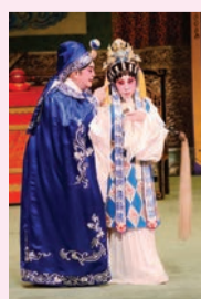
世顯欲與公主相認