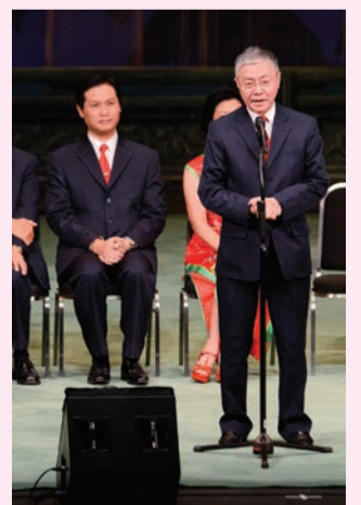
阮兆輝副主席致謝辭