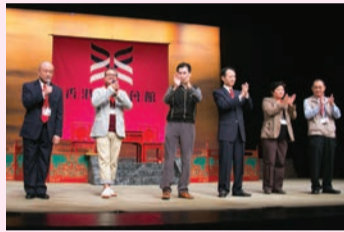
演出後八和理事向觀眾謝幕