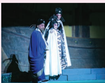
李煜及小周后不忍臣民再受戰火摧殘，黯然上路，去國歸降