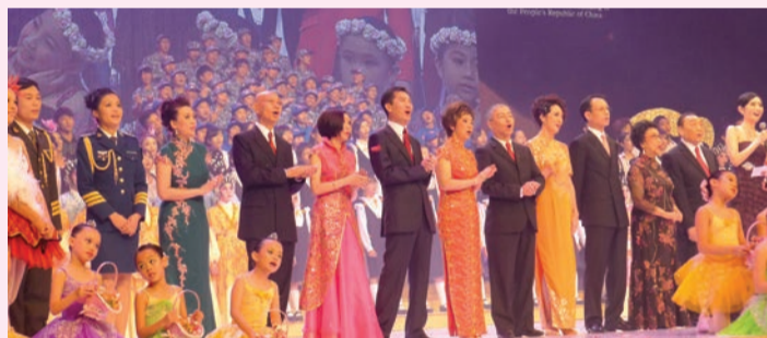
演出老信與其他表演嘉賓一起在台上高歌