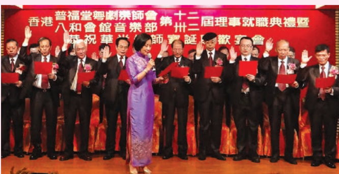
汪主席主持監誓，全體理事成員站立舉右手宣誓