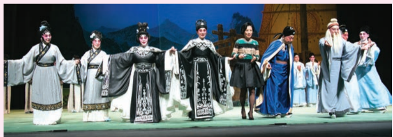
完成演出後，汪明荃主席帶領眾人謝幕，感謝觀眾對粵劇的支持