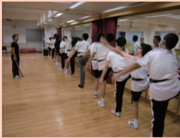
二十位初中一學生接受粵劇訓練