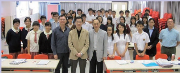
師生合照。(學生來自不同中學)