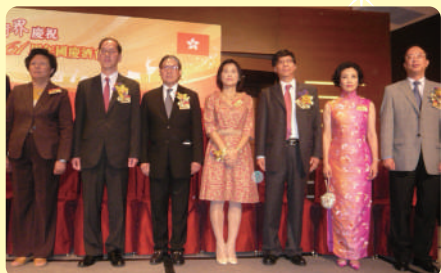
Ⓛ (左起)全國人大常委范徐麗泰大紫荊勳章太平紳士、民政事務局曾德成局長、國慶籌委會贊助人霍震霆議員、康文署馮程淑儀署長、國慶籌委會贊助人區永熙先生、汪明荃主席、國慶籌委會主席馬逢國先生