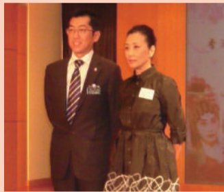
汪明荃主席與東華三院梁定宇主席合照

本計劃的最終目標，是希望將粵劇納入正規教育系統內：在初中階段(中一至中三)進行粵劇基礎課程，然後於高中階段(中四至中六)進行粵劇「專科課程」或「應用學習課程」。更甚者，選修應用學習課程的學生可以參與中學文憑考試。學生在中學畢業之後，將具粵劇知識和技能，他們或可銜接香港演藝學院繼續深造，以至修讀其他大專院校課程，例如教育學院「創意藝術及文化文學士」課程。