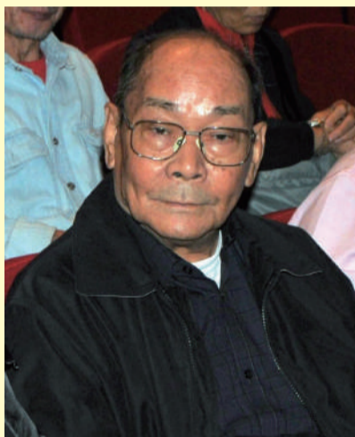
粵劇前輩文全先生專程由外國回港參與華光誕慶典