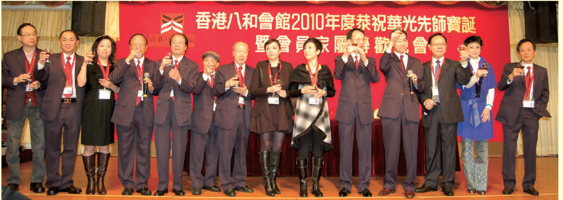
全體理事上台敬酒，致謝各位嘉賓對八和的支持

香港八和會館本年度為華光師父誕舉行慶祝會，於11月4日(農曆九月廿八日)下午二時十五分，假高山劇場演出《香花山大賀壽》及《天姬大送子》；晚上假紅磡海逸皇宮大酒樓進行聯歡及籌款晚宴，收益在扣除開支外，餘款撥作長者會員的『關懷行動』(向會員提供住院慰問金)及未來推行粵劇教育。