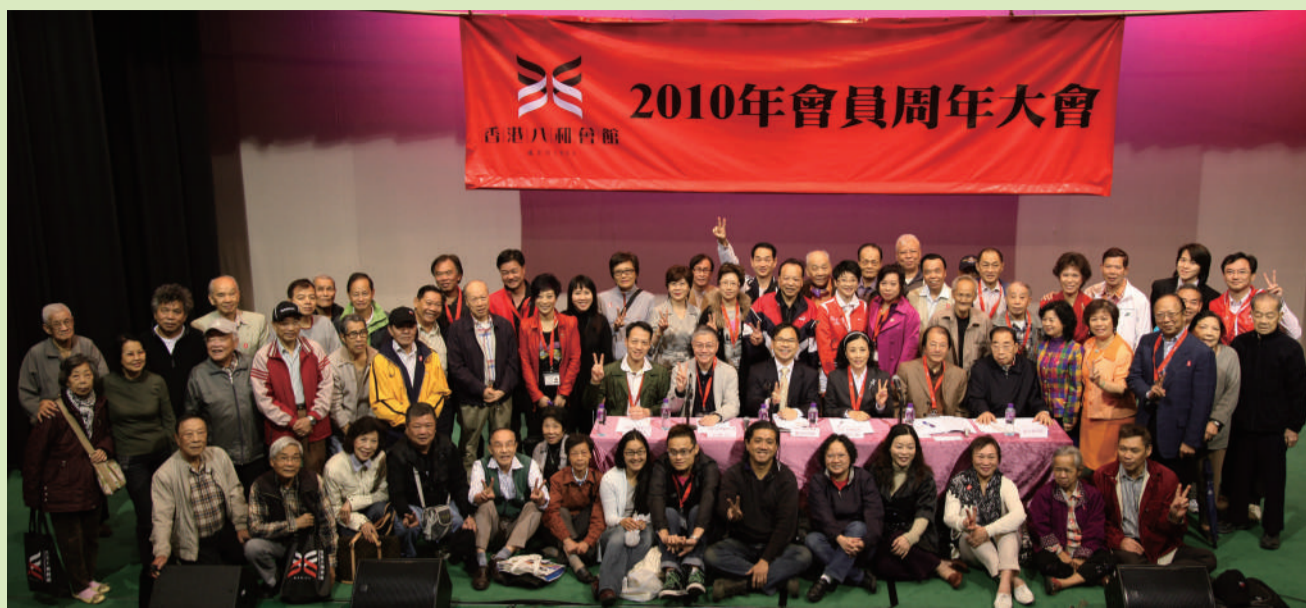
理事會各成員與各會員大合照

香港八和會館於2010年11月27日，在新光戲院二院舉行「2010年會員周年大會」。大會有八十四位會員出席，但由於未達會章規定的一百位法定人數，因此原定的會員周年大會改以非正式會議進行，並按會章規定而延會至12月8日在八和會館會議室舉行。以下是汪明荃主席暨第三十四屆理事會的「2010年工作報告」：