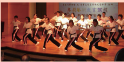
參與計劃的學生正在練習基本功