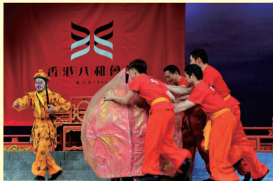
孫悟空(王四郎)與眾猴子-武師