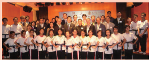
眾嘉賓師生大合照