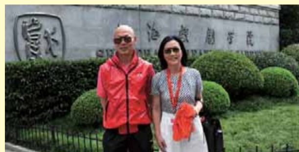
羅家英、汪明荃攝於上海戲劇學院前