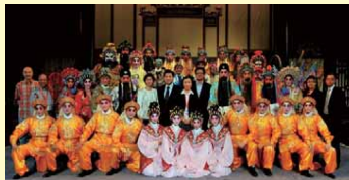
香港政制及內地事務局局長林瑞麟觀看首晚演出及上台與香港八和會館各演員合照