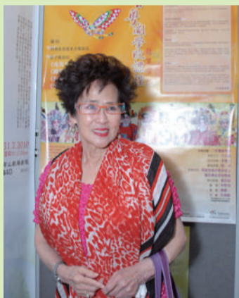
粵劇紅伶吳君麗小姐