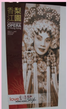
山頂廣場「香江梨園」海報