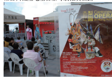
山頂廣場舉行粵劇演出吸引大批遊客