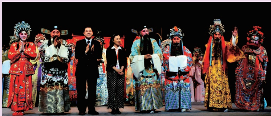
①汪主席與林瑞麟局長和各位演員一起在台上謝幕