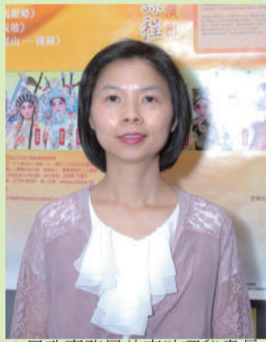
民政事務局長賴黃淑嫻女士