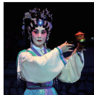
在世博演出的汪明荃 - 貂蟬