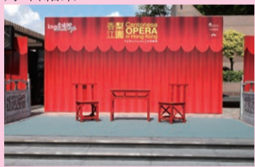
山頂廣場舉行「香江梨園」粵劇演出