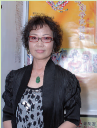
粵劇紅伶尹飛燕小姐