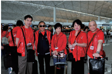
演員起程到「2010上海世博」演出