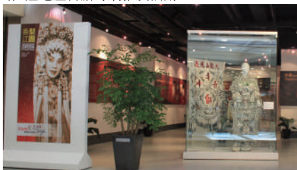
恆隆地產山頂廣場推廣活動