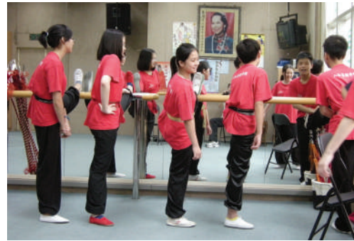
青少年班學員熱身準備考試。