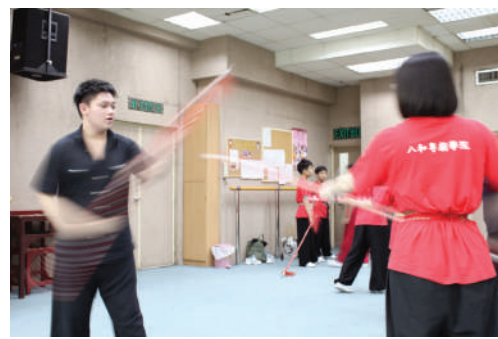
青少年學員積極練習。