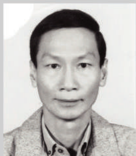
李文驊 演員組 二〇〇九年十二月十四日逝世