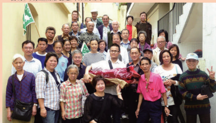
春祭:春祭完畢後理事會各成員暨會員大合照。