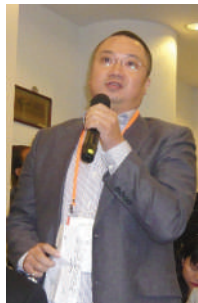
演員陳鴻進發表意見。