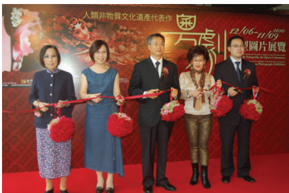
左起：澳門曲藝總會林鳳娥會長、粵劇名伶倪惠英、澳門中聯辦文化教育邵李正橋副部長、粵劇名伶吳君麗、澳門文化局代局長陳澤成。