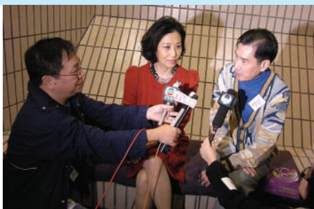
汪主席及副主席新劍郎介紹香港粵劇。