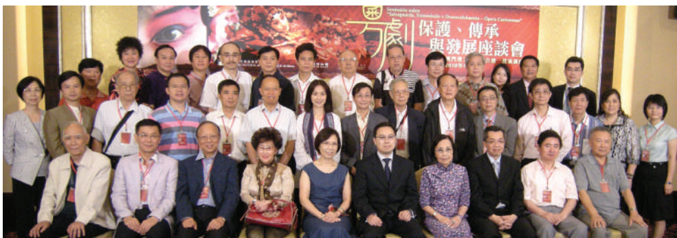
粵港澳《粵劇——保護、傳承與發展座談會》與會嘉賓大合照