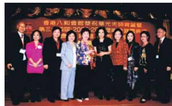
麥林曼樾投得寶葫蘆