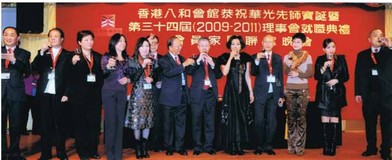
2009年11月14日晚上於紅磡海逸皇宮大酒樓，舉行慶祝華光先師寶誕晚宴。