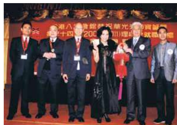
高金沛投得寶花籃