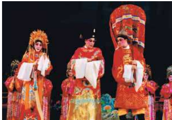
把子抱在懷惹人愛