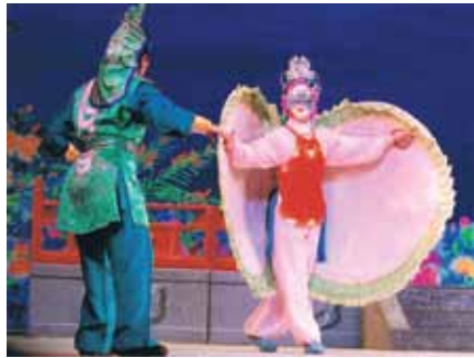
戴上面具的蚌在找蝦