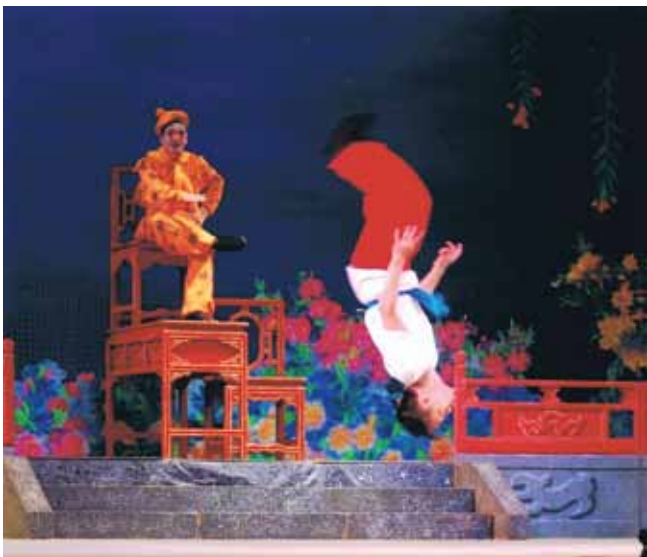
孫悟空看猴兒玩耍