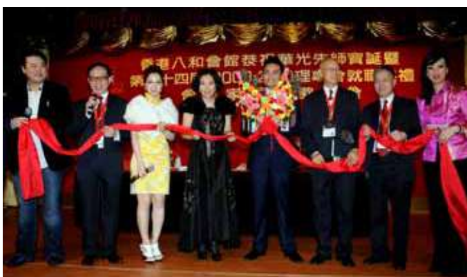
劉石佑投得萬里長紅