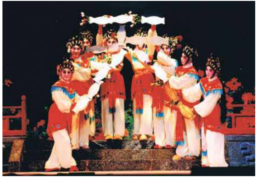
八仙女擺花天下太平的天