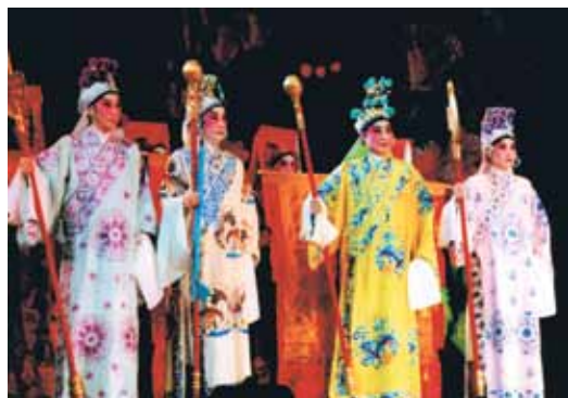
殺手裙與百足旗護送董永遊街