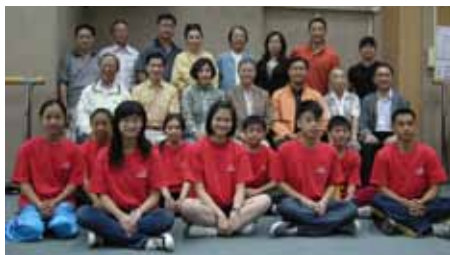
八和粵劇學院主辦的青少年粵劇演員訓練班,於2009年9月27日正式開課。八和制定了四年制的培訓計劃,由粵劇界專業導師及資深演員任教,以循序漸進的訓練方式,為粵劇界培訓下一代表演接班人。