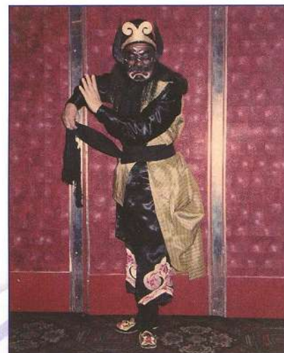
陳醒棠飾伏虎羅漢