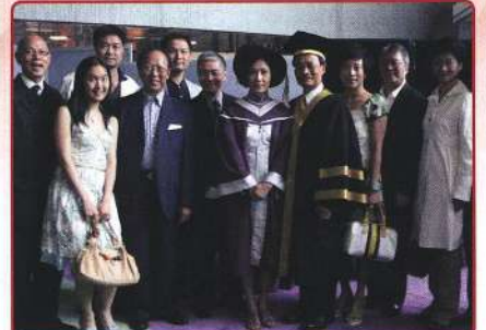
八和同業賀主席獲院士榮譽