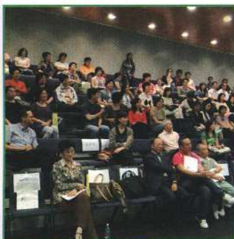
研討會參加者十分踴躍