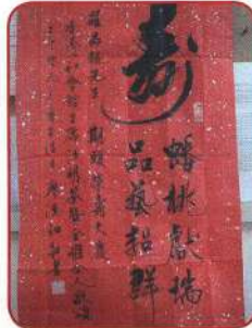
蟠桃獻瑞 品藝超群