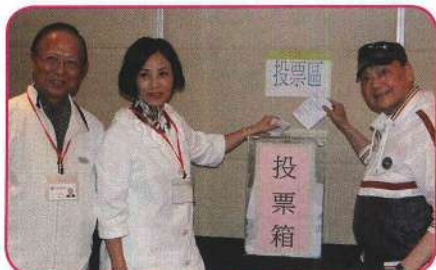
李奇峰、汪明荃、尤聲普