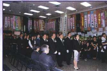
由主席汪明荃帶領公祭

如今，粵劇除了要爭取演出場地之外，由演員至所有幕後工作者，都急切需要接班人。我在這裡講一句衷心的說話：八和所有優秀藝人，希望他們負上新火相傳的責任，各部門幕後工作者，也要扶掖與教導後輩，更希望目今所有的藝人，要認真地演出，爭取更多觀眾支持，各方面工作配合，粵劇一定有美好的一天。