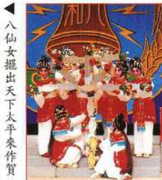
八仙女擺出天下太平來作賀。