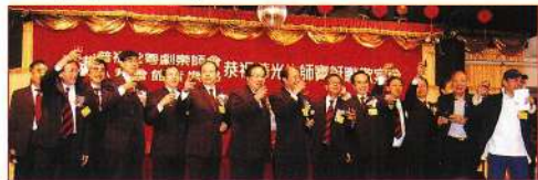
▲ 普福堂慶祝華光誕，向嘉賓祝酒。