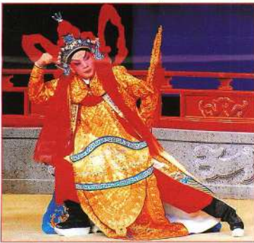
羅家英章陀的睡架。