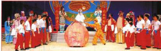
孫悟空與眾猴兒向觀音拜壽。