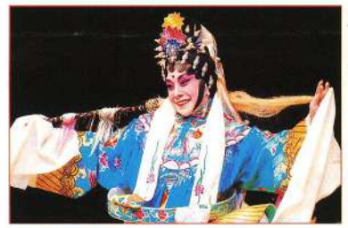
觀音十八變，變作樵夫時。