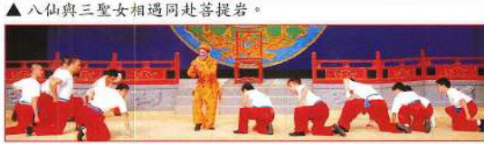
孫悟空在花果山囑猴子備賀禮。