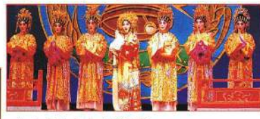
七仙女在天上傳佳音。