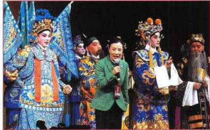
▲汪明荃主席於《新二王》首演謝幕，上台致謝詞。