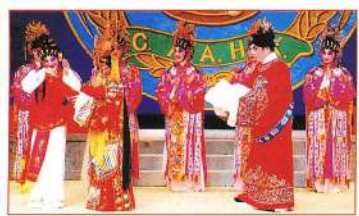
抱子仙姬把嬌兒交到天姬手。