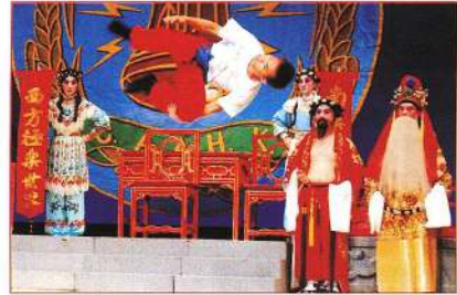
觀音十八變，變法相時由武師翻騰。