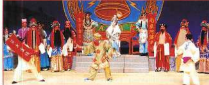
曹保變法大灑金錢。