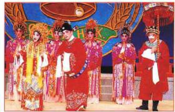
董永得知天姬送還嬌兒。