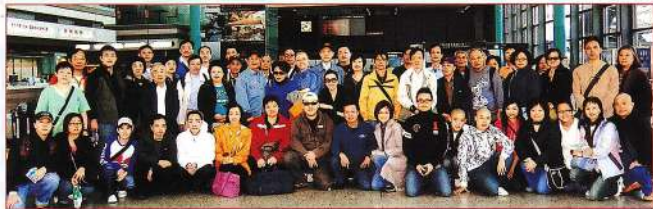
▲香港八和粵劇演出團在紅磡出發時的大合照。