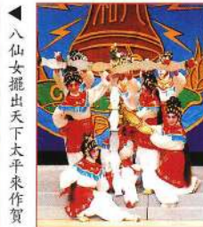
八仙女擺出天下太平來作賀。