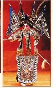
▲張忠(龍貫天) 獲得無箭頭的箭矢。成就了拗箭結拜。