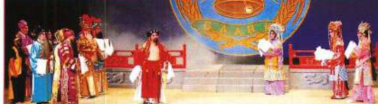
八仙與三聖女相遇同赴菩提岩。