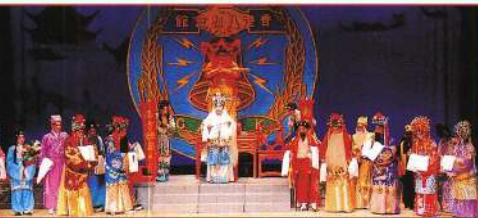
八仙、四龍王和三聖母同向觀音拜壽。