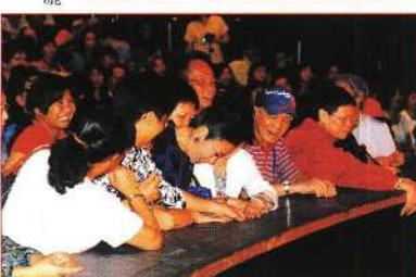
汪主席與觀眾同拾金錢。