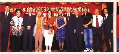
▲祝聖如投得寶扇，與八和理事合照。