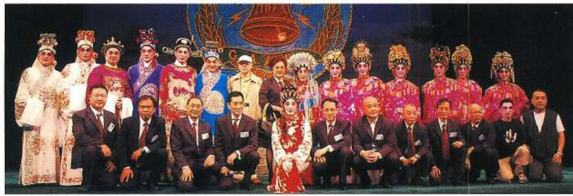
理事們與演員合照。