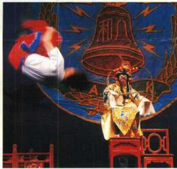
孫悟空與猴子同樂。