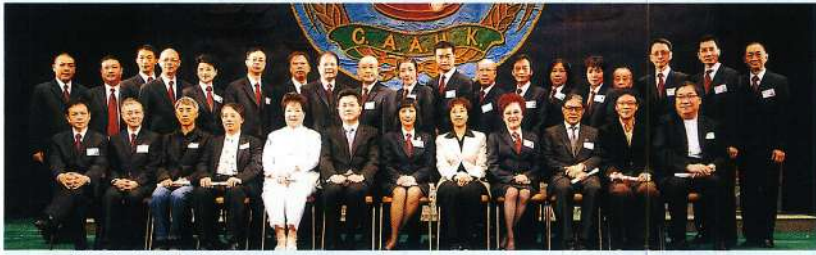
理事們與顧問嘉賓合照。