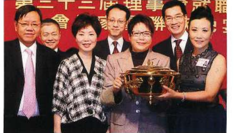
澳門黃姑娘投得聚寶盆。