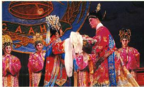
礙於仙規，有情人要分離。