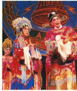
董永感謝仙姬送子回。