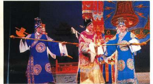
董永為儀仗所阻，只能目送仙姬回天。