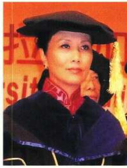
汪主席獲世界傑出華人名銜。