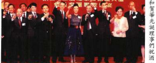
八和賀華光誕理事們祝酒。

但是，粵劇資源問題才是「最刻不容緩」。近年，特區政府對於戲團團體曾作出資助，無奈增多稀少，只屬杯水車薪。 希望政府在申請援助及補貼團演出經費方面作出更詳細的考慮。既定出清部份申請條件，並把申請計劃分成職業及業餘兩個部份，俾使職業演員能得到較公平的批准可能性。增添職業演員就業機會。演出者生活安定，對演出水平也有裨益。 根據統計顯示，目前經申請而得以受惠者，以業餘玩票者居多，以實力論，當然不及職業演出者，因此，有等得到補助之業餘團體，為求取得觀眾入場，竟然作出免費「送票」安排，長此下去，會變成觀眾無需支付娛樂費用，便有戲睇之惡習，對粵劇職業表演團體影響至深，更嚴重影響職業團體生存之希望，後遺症甚為嚴重。 本人能望政府有關問題加以研究改革，支援職業演出者，令粵劇演員得到更多就業機會。能吸納更多觀眾，對普及和推廣粵劇會有較好的益。 點樣公平、公正及均衡地分配資源？值得政府深入考慮。至於粵劇同仁，無論台前幕後，亦需努力不懈，力求增值，令演出更臻完美。 最後，本人特別感謝八和會館歷屆理事及同業，一直為爭取粵劇權益努力，更加感謝社會各界人士大力支持協助，期盼在新屆八和會館主席汪明荃小姐領導之下，梨園子弟能凝聚一股新力量。本人深信，只要我們虛心誠意，要求合理，特區政府必然會更支持粵劇。