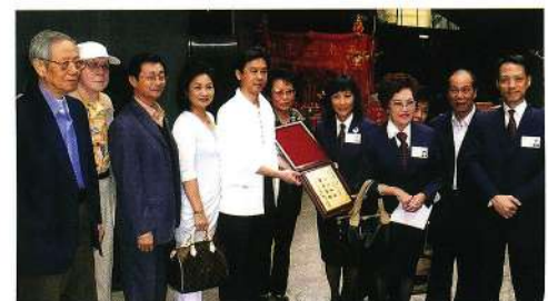
廣州八和代表到賀本會慶祝華光誕。