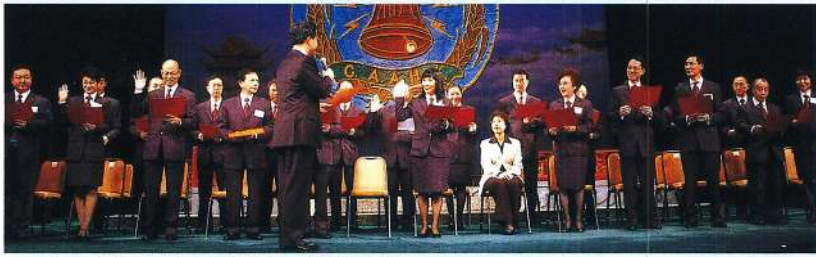
理事會就職，中聯辦副主任李剛先生監誓。