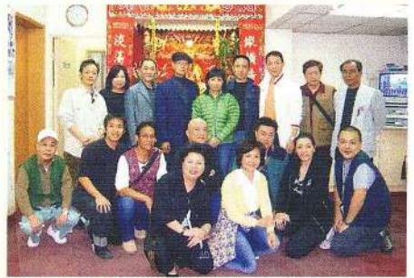
主席與理事出席為華光落地賀壽。