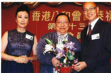
家英之友投得寶花籃。