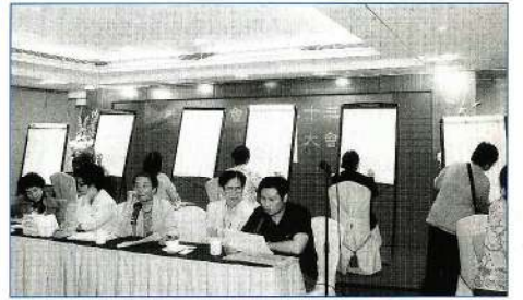
唱票和監票與點票工作。