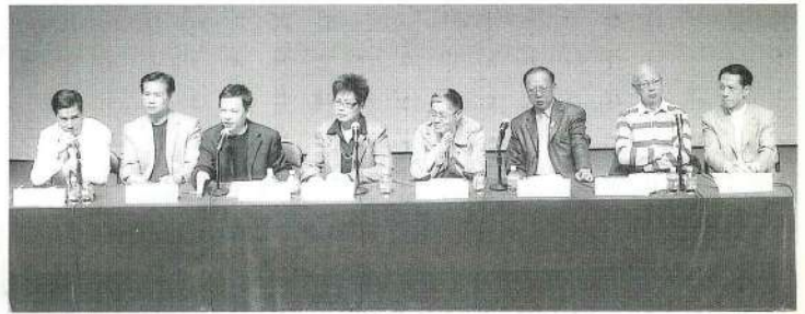
爭取場地小組主持論壇。