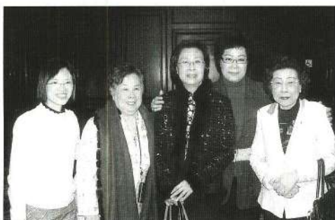
主席出席鑪峰團拜與徐太、羅艷卿、伍麗嬌合照。