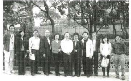
爭取永久演出場地小組視察高山劇場。