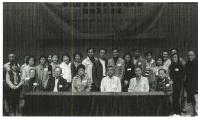
出席發佈會的粵劇界。