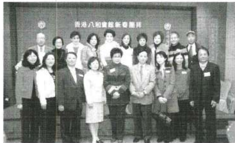
八和理事與嘉賓合照。