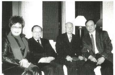
陳劍聲與查良鏞、陳復禮、蔡文中合照。