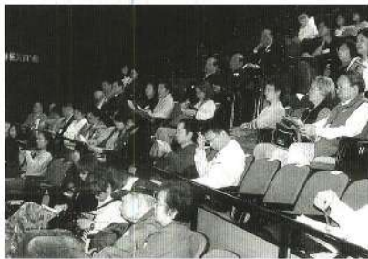
出席發佈會的嘉賓。