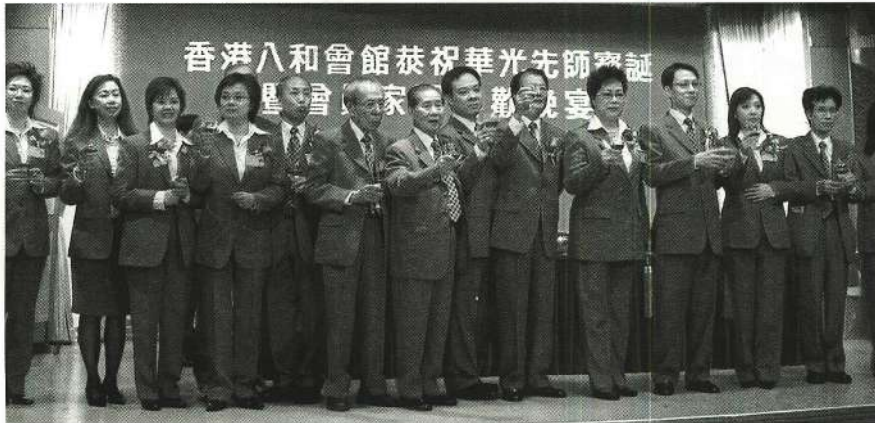
理事們向嘉賓敬酒