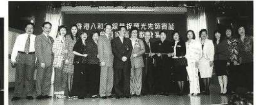
澳門粵曲總會投「降魔寶劍」