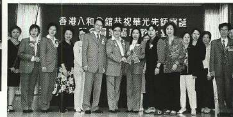
朗暉粵劇團投「測版」