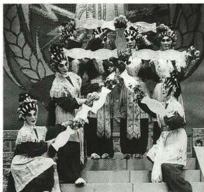
八仙女插花天下太平之天