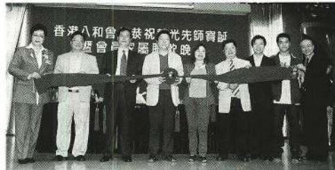
東方靈芝寶投「萬里長紅」