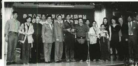
璋順倉務運輸有限公司投「聚寶盆」