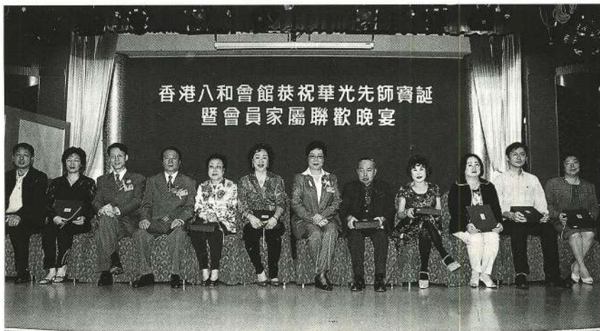
出席領取紀念品的嘉賓