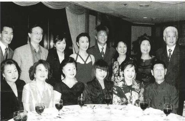
麗莎與行哥及粵劇界同業合照。

本會會長前主席汪明荃於2004年7月獲香港特區政府頒授銀紫荊星章，以肯定其事業成就和對社會的貢獻，評語是：「在本地演藝界有傑出表現，成就卓越，熱心參與公共及社會服務，貢獻良多，努力不懈，終身學習，堪稱典範。」