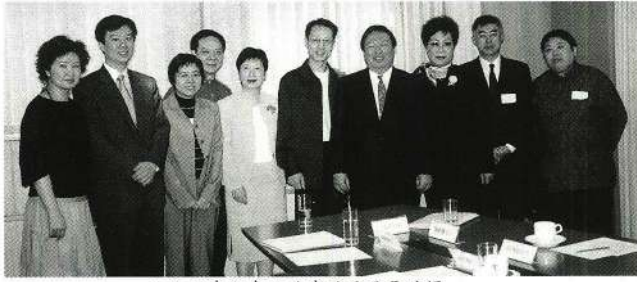
八和理事拜會民政事務局長時攝