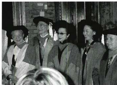
白雪仙與獲名譽博士人士合照

白雪仙十四歲時拜萬能泰斗薛覺先為師，改藝名為白雪仙。一九五六年與任劍輝組仙鳳鳴劇團，一九九〇年成立任白慈善基金會，支持廣東傳統戲曲的研究工作者；一九九六年他獲香港演藝學院授榮譽院士銜；一九九七年又獲香港大學授予名譽文學博士學位，是予以表揚其貢獻。