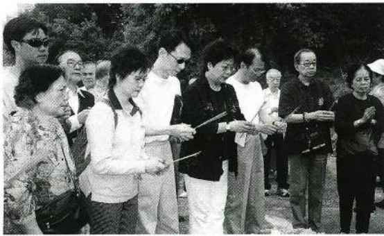
理事會與會員們上香。