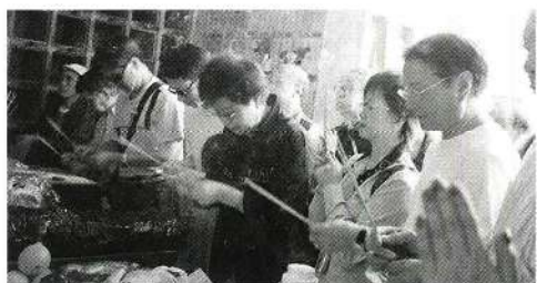
八和全仁向東華堂友友上香。