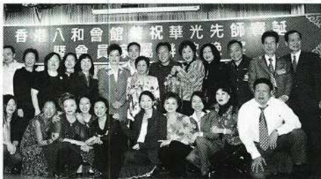
庾艷雲小姐得「發財寶燈」