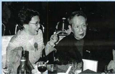
吳君麗周侯開海山