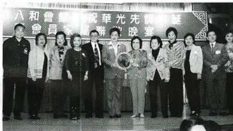
林彭桂貞女士得「伏虎圈」