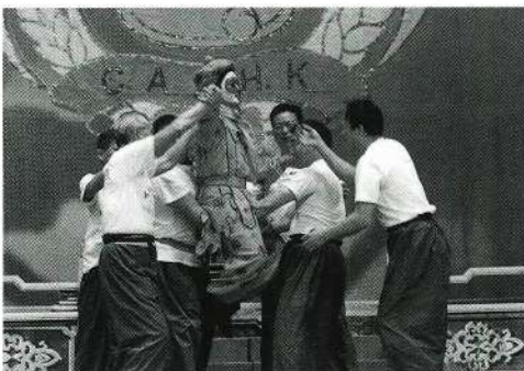
花果山的猴王與猴子