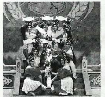
八仙女砌天下太平