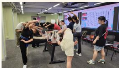
香港資優教育學苑