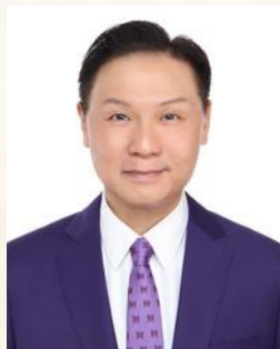
龍貫天 BBS, MH