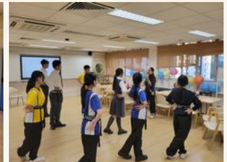
寶安商會 王少清中學