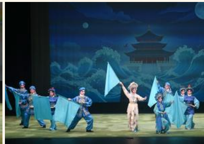
《白蛇傳之水漫金山》