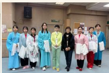
《龍鳳爭掛帥之洞房》 導師：劉惠鳴、鄧美玲