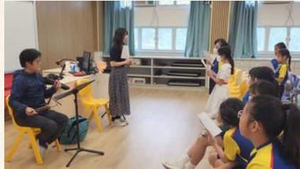
保良局 莊啓程第二小學