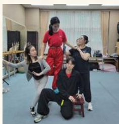
《白蛇傳之斷橋》 導師：陳詠儀、梁芷琪