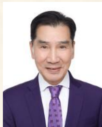
新劍郎 MH, CEC