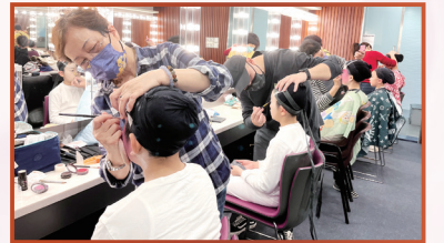
學生妝身準備演出