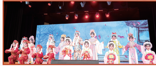
錦泰小學及蕭漢森小學合演《鳳閣恩仇未了情》

最後，恭賀保良局教育服務保持蓬勃發展，未來繼續培育社會棟樑，希望將來持續與局方發展不同粵劇普及課程。