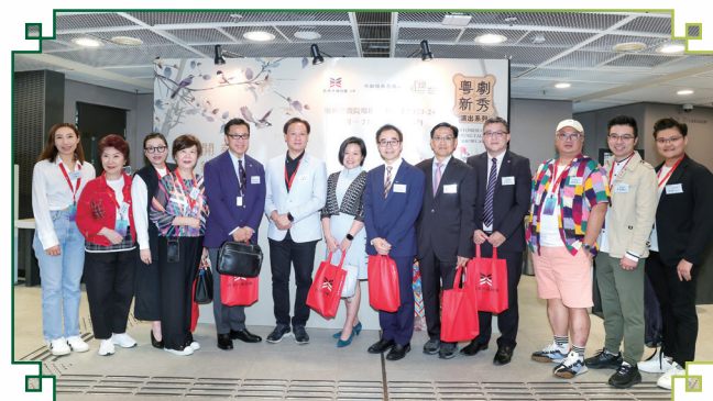
一眾理事及各單位官員於開幕儀式前合照留念