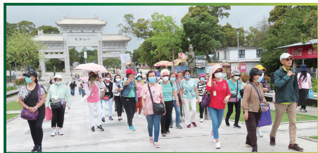
一同遊覽昂坪山市集