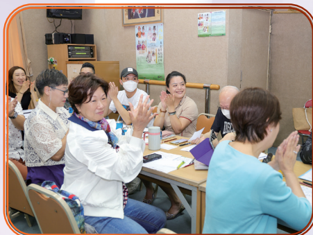
新任理事會順利誕生!