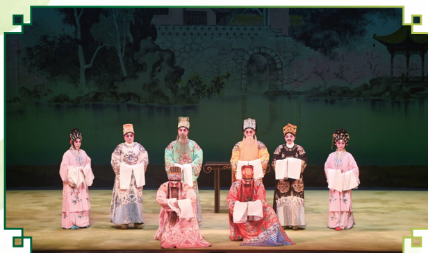
開幕演出開始前特別加演傳統例戲《八仙賀壽》、《跳加官》及《小送子》