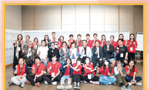
一眾理事、職員和工作人員合作無間，讓第40屆理事會選舉得以圓滿完成