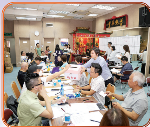
眾理事為各職務投票