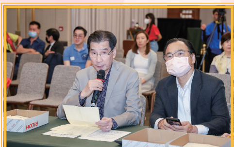
第39屆理事會副主席新劍郎唱票