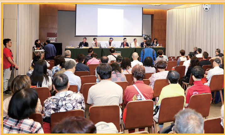
會員專心聆聽會議內容