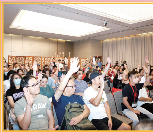
會議現場氣氛熱絡