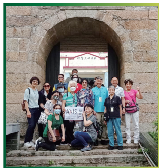
會友遊覽東涌小炮臺