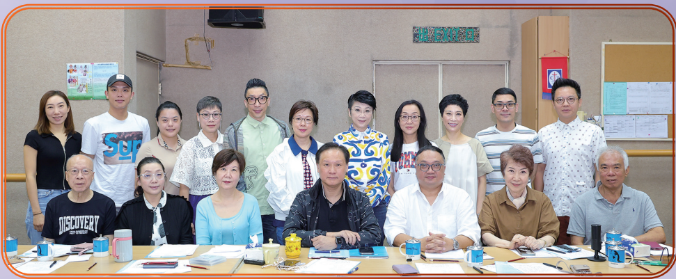
第40屆理事會合照留念