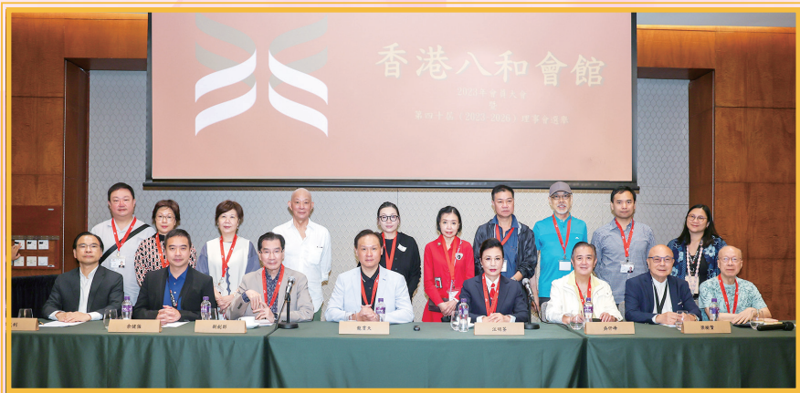
第39屆理事會理事及嘉賓於台上合照

出版：香港八和會館 地址：九龍油麻地彌敦道493號 展望大廈4字樓4室 電話：23842929 傳真：27707956 電郵：enquiry@hkbarwo.com 網址：www.hkbarwo.com 承印：High Technology Printing Group 內部資料，不得轉載