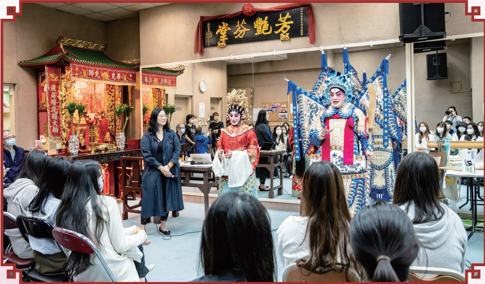
新秀演員向港大碩士生講解粵劇

工作坊結束後，本會前總幹事偕同項目主任帶領一眾大學生前往高山劇場和資訊中心參與導賞。在一整天的活動中，同學們反應熱烈，獲益良多。