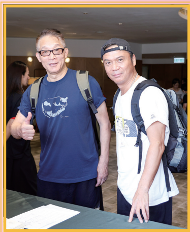
一眾會員身體力行 積極參與會議