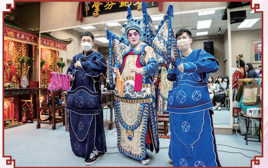
港大碩士生積極與新秀演員互動