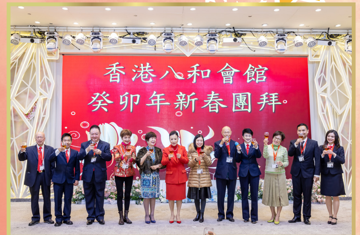
眾理事在台上祝酒，祝願新一年「兔」氣揚眉。