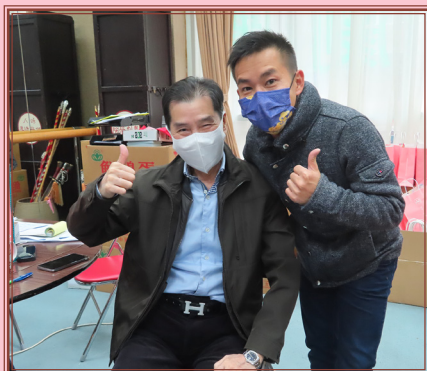
新劍郎副主席及蔡之歲理事到場打氣

鑑於政府放寬防疫措施，本會復辦本年度「歲晚福利及義診服務」活動，一連三日（2023年1月6至8日），已於八和粵劇學院順利舉行。