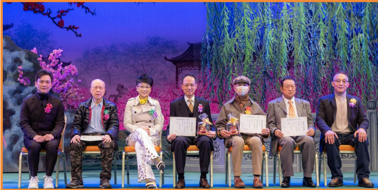
眾嘉賓出席鑾興堂第廿一屆理事會就職典禮

鑾興堂前身稱為德和堂，乃八和會館其中一個屬會，是打武家的堂口。而龍虎武師是戲行中一個專業行業，又稱五軍虎，是在戲班中專職負責武打及翻騰，不兼演其他角色。鑾興堂在2023年第廿一屆加入年青一代武打演員作為理事，輔以前輩共同分擔會務，期於日後振興武行，展現英姿，再放光芒。