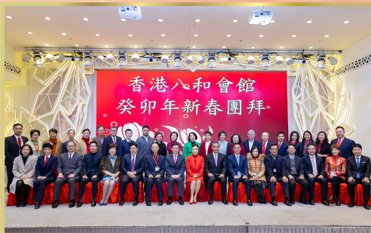
眾嘉賓與八和會館理事大合照