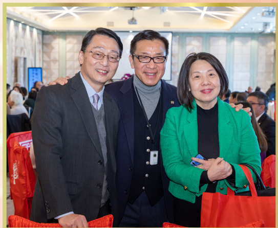
康樂及文化事務署署長劉明光先生（左起）、西九文化區管理局西九戲曲中心顧問小組主席楊偉誠博士、中國文學藝術界聯合會香港會員總會（香港文聯）秘書長彭婕女士合照