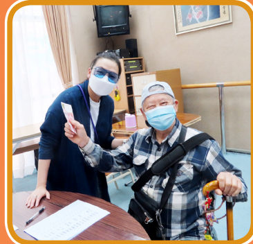
資深會友到場領取利是