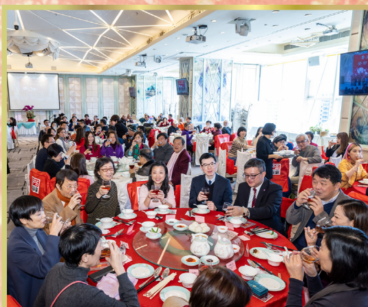
高朋滿座，享受新春團拜午宴。