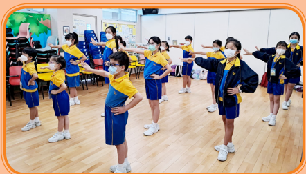
蕭漢森小學學生正在上表演課