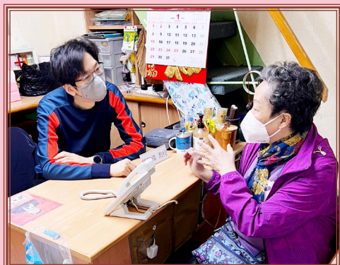
內科及醫病科鄧智偉教授替會友提供免費健康檢查和諮詢