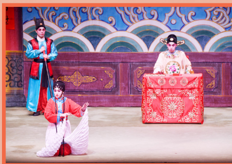
《三司會審狀元妻》之〈公堂〉，這次由八和新秀接棒演出。