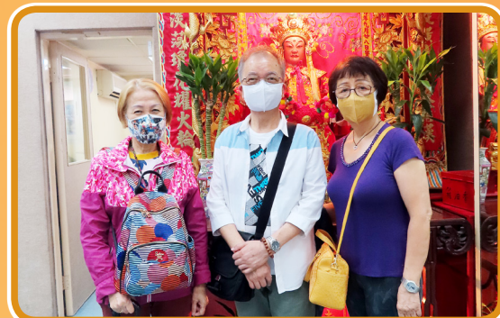
當日派發利是過程順利，不少會友更誠心奉香。