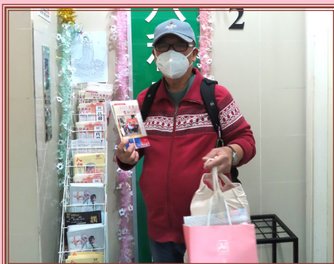
不少會員領取由善長派發的賀年禮品，感到非常開心