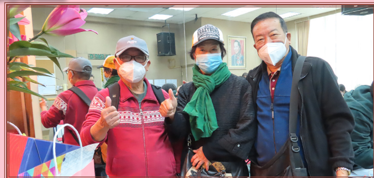
當日活動有不少會友到場領取歲晚利是

整個活動流程非常順利，在職員的悉心安排下，各會員耐心辦理領取歲晚利是、繳交會費及福壽金供款。事後統計，今年接近600位領取歲晚利是。