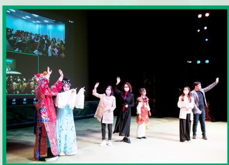
香港學生與馬來西亞學生積極參與互動