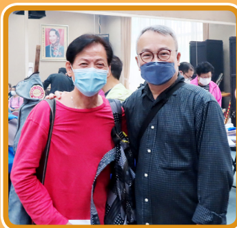
不少會友聚首一堂

本年度任白基金的長者利是已於11月29日，在八和粵劇學院順利派發，預計約370位會友受惠。