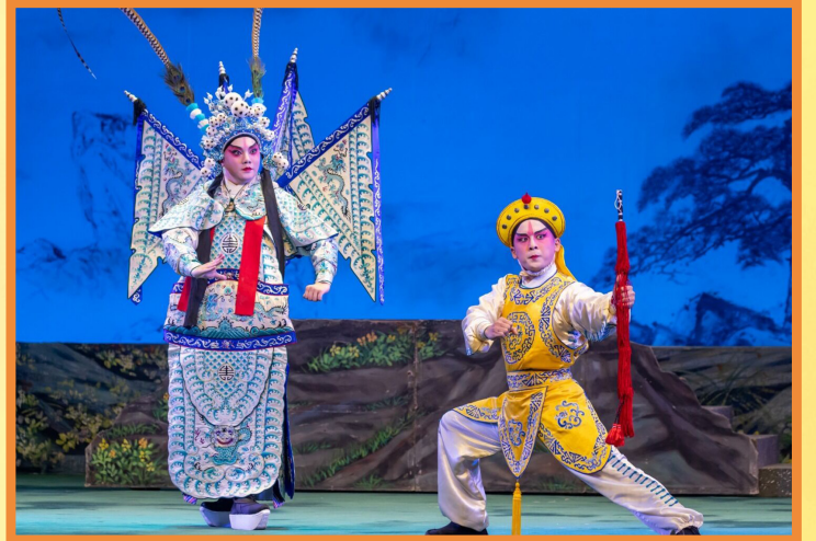
龍虎武師在戲行中專職武打和翻騰