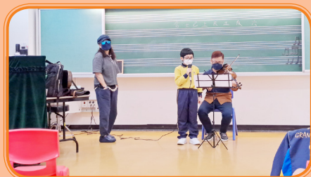
錦泰小學學生正在上唱功課

適逢今年度保良局舉辦「慶祝香港回歸25周年暨保良局教育服務75周年匯演」，本院導師正籌備及指導兩校學生共同完成一項折子戲表演，準備工作如火如荼，期待屆時欣賞兩校學生的表演。