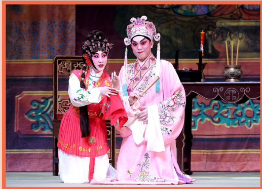
風流才子唐伯虎於廟中對秋香三笑定情。