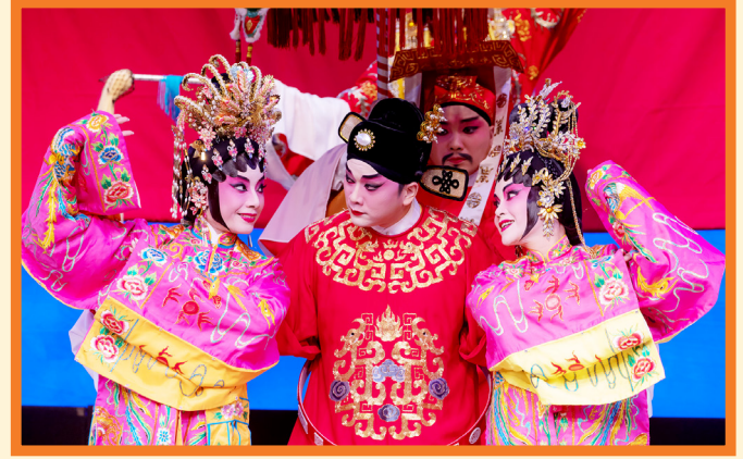
「反宮裝」是此劇其中一個焦點，仙女們配合身段，利用傳統的反宮裝瞬間轉換衣飾