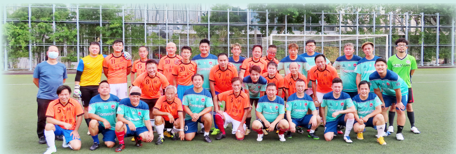
八和足球隊與九龍巴士足球隊賽前大合照