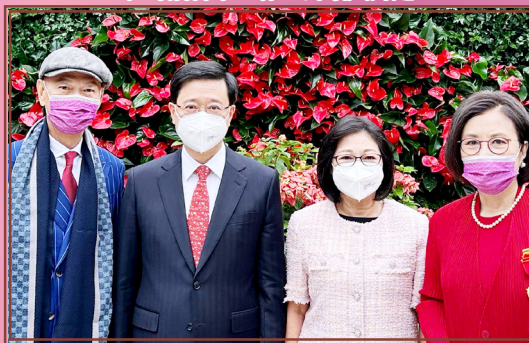
（左起）羅家英理事、行政長官李家超先生及夫人林麗嬋女士、主席汪明荃博士合照