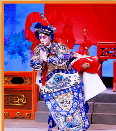
「韋馱架」乃《香花山大賀壽》的重頭戲之一