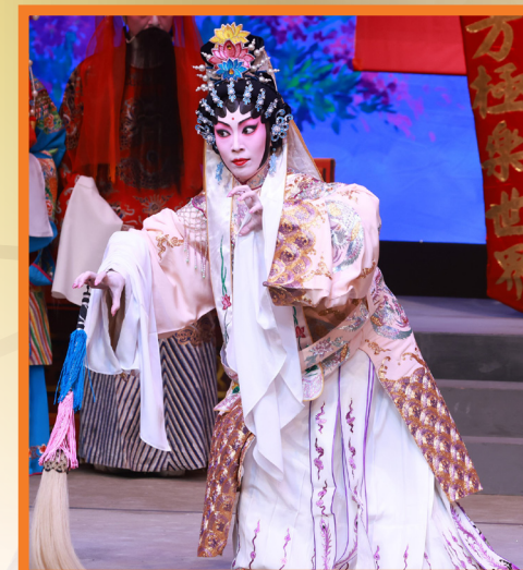
觀音透過形體動作，正在擬仿「虎」的形態，活靈活現