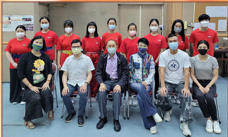
一年級學員與主禮人合照

本年度青少年班暫時仍延續上學年的疫情課堂安排，由疫情前的全日課程（上午10時至下午5時，3節，每節2小時）縮減為半日課程（中午12時至下午4時半，3節，每節1.5小時）。