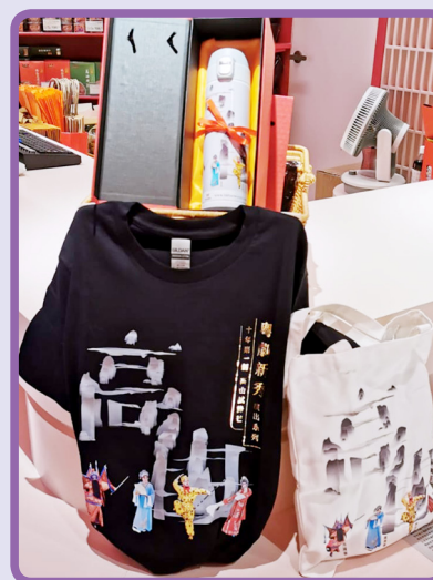
不同款式的紀念品

如有意購買，可前往以下地址：尖沙咀柯士甸道西88號7號舖戲曲中心地庫二樓7號舖，近柯士甸站E出口。