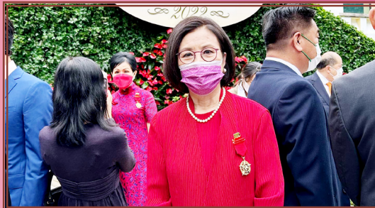
是次榮獲金紫荊星章，是對主席汪明荃博士在粵劇傳承工作上的最大肯定