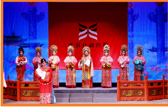
仙姬七姐（陳紀婷飾演）及一眾仙姬（司徒凱誼、芯融、王希穎、文雪雲、吳穎霖、莫心兒飾）再度下凡，送還她與董永所生的愛子