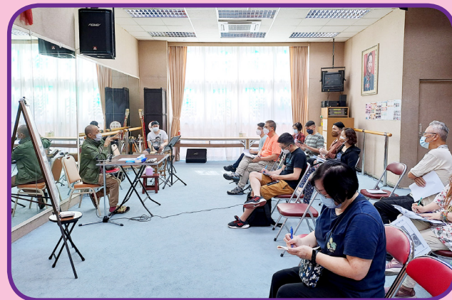
學員全神貫注上課