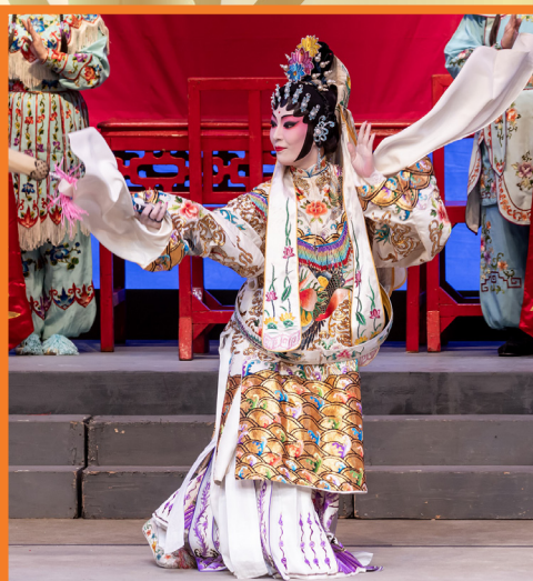
觀音於台上展演「觀音十八變」