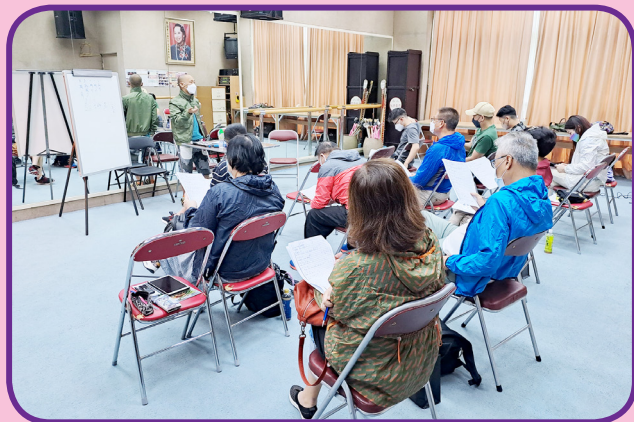
游龍師傅講解鑼鼓譜用語