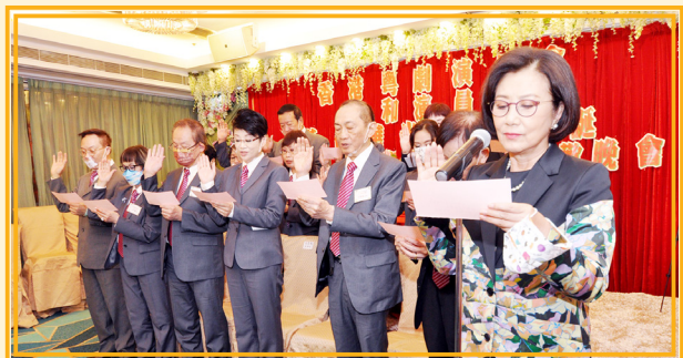
第十二屆理事會正在宣誓，由汪明荃博士監誓

10月23日晚上，香港粵劇演員會（亦稱演員會）已於九龍聯邦金閣酒家，舉行第12屆理事會就職典禮，並邀請香港八和會館主席汪明荃博士擔任主禮嘉賓。