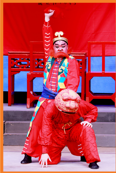
降龍羅漢（劍麟飾）手持降龍寶珠，降伏神龍