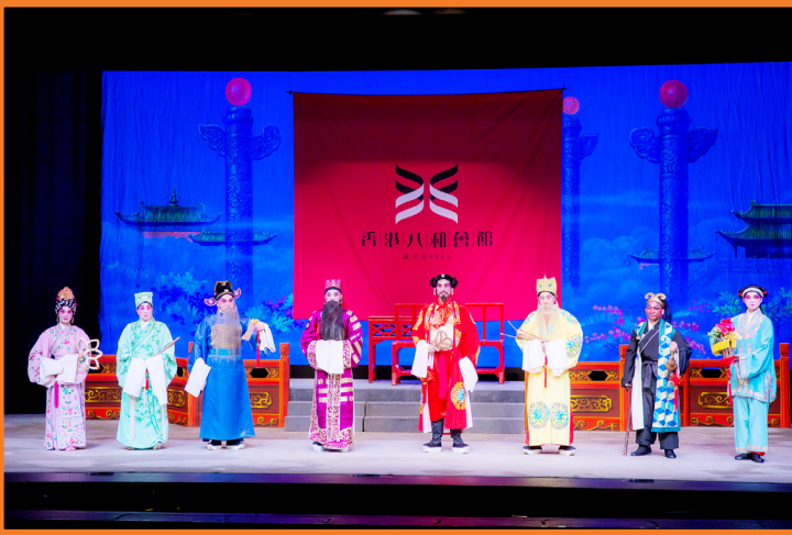
八仙各持自家聖物依次亮相後，相約一起前往紫竹林向觀音祝壽（雲燕伶、鄭慧賢、楊健強、麥熙華、朱兆壹、馮偉才、黃永傑、陳景鉤飾）