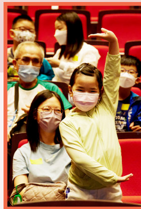
現場小觀眾即興學習臺上演員擺手

2022年8月20、21、27、28日，連續兩個星期六日，由藝術總監王超群指導上演了取材自《西遊記》當中的〈鬧龍宮〉，跟隨孫悟空闖蕩龍宮，與蝦兵蟹將大戰一番，再智斗龍王奪取兵器，最後孫悟空成功攜同兵器回去花果山。