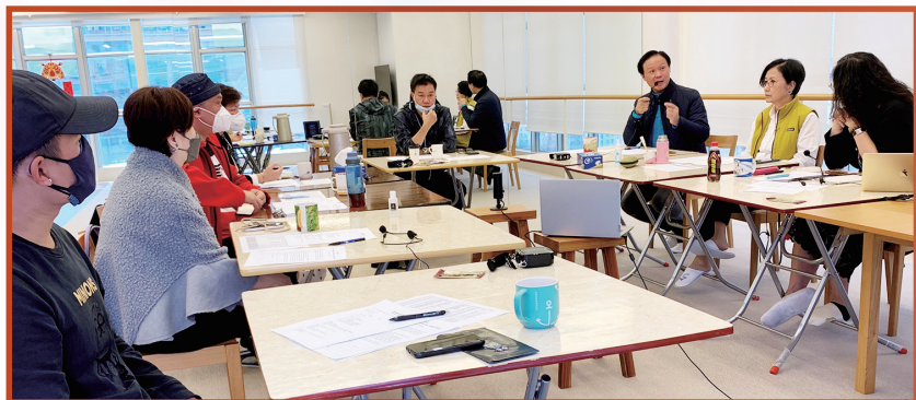
第一次防疫小組會議