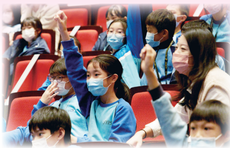
同學們爭相回答問題