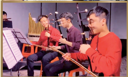
諾丁漢大學表演片段