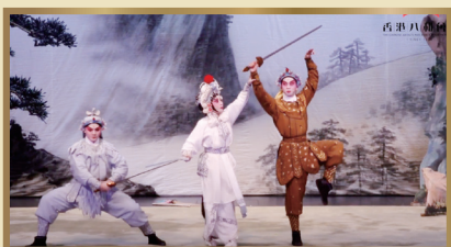
八和會館表演片段

2022年3月9日，香港八和會館、八和粵劇學院與諾丁漢大學馬來西亞分校簽訂交流合作備忘錄，未來兩年八和將率領本地粵劇名伶、新秀演員、年青樂師及學院學員，分別於2022年底和2023年上半年前往諾丁漢大學的馬來西亞分校及英國本校進行交流。