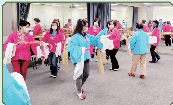
學員學習使用「水袖」及「馬鞭」