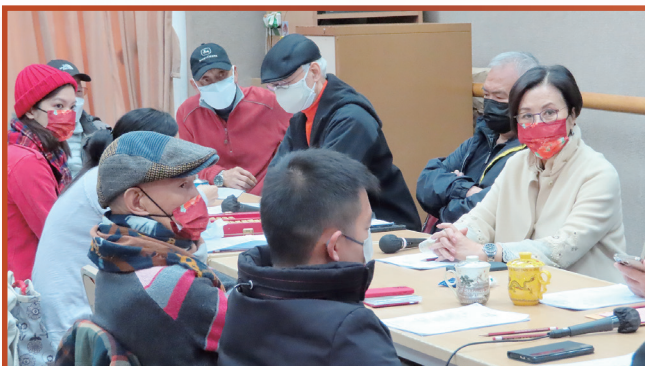
在會上如何進一步為業界爭取政府的支援