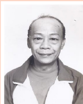
譚達培〈譚少棠〉 (演員部) 1939—2021