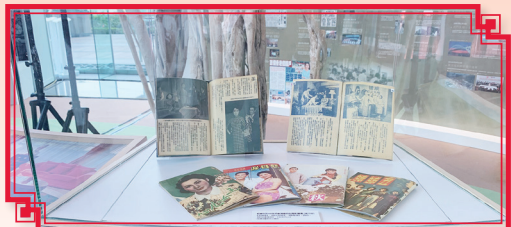
粵劇名伶紅線女專櫃