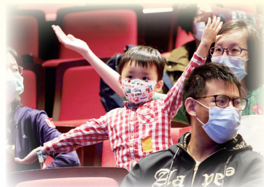
小觀眾模仿「造手」，神情專注

幾年前，本計劃曾改編西方童話伊索寓言〈北風與太陽〉、《三隻小豬》，以及去年新編粵劇《秋冬歷險記》大受歡迎，今年「合家歡粵劇」回歸傳統，已於十一月下旬上演《寶蓮燈》之〈二堂放子〉及〈劈山救母〉。在藝術總監王超群帶領下，是次演出成果非常顯赫，兩場折子戲一文一武，各有支持者。在導賞環節，不少小朋友非常踴躍回答問題，領取獎品，也跟從演員學習「唱、做、唸、打」四項粵劇基本功，初步認識粵劇的藝術價值，進而培養鑑賞能力。