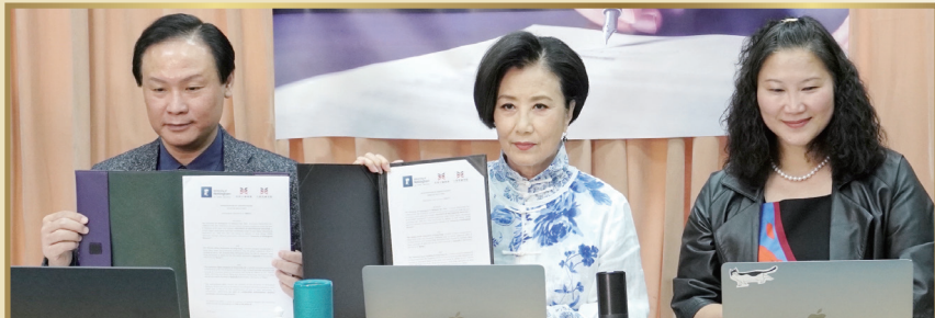
八和會館、八和粵劇學院及諾丁漢大學簽訂交流合作備忘錄