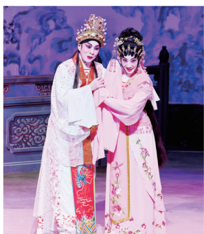
文華與瓊花女再度合演《洛神》