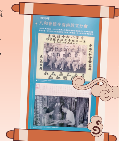
香港八和會館第一屆理事會就職典禮