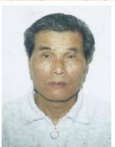
黃彭 (演員部) 1928—2022