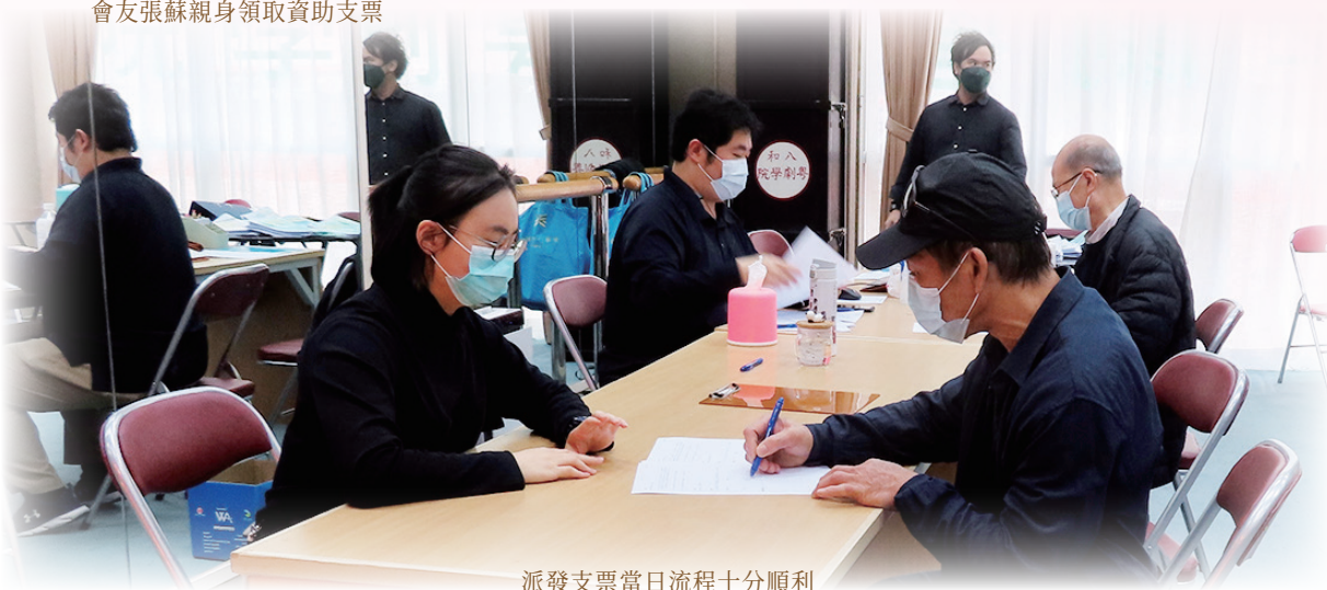
派發支票當日流程十分順利