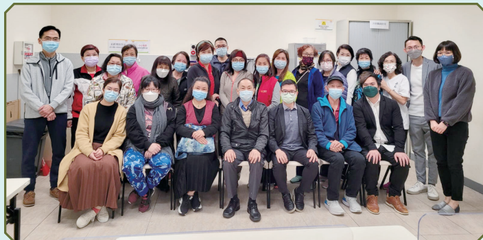
老師、全體學員及工作人員合照