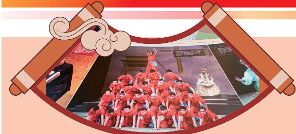
香港八和會館《觀音得道·香花山大賀壽》劇照(2007年)

2022年1月8日實體展覽結束後，香港地方志中心另設線上圖片展覽，可到香港地方志中心網站重溫香港八和會館及本地粵劇昔日照片。