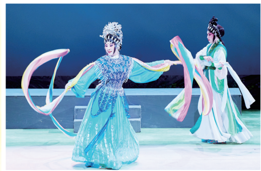
瓊花女的舞姿配合燈光班學員所設計的燈光，尤其綺麗