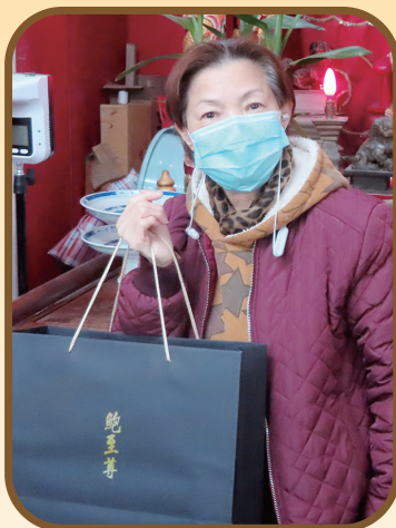
一眾會友趕在農曆新年前到會館領取賀年禮品；有的則幫其他相識的會友一併領取。