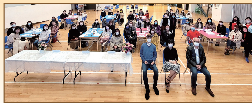
全體參加者及工作人員合照