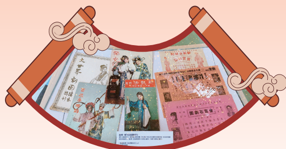
戲橋、場刊及劇團特刊