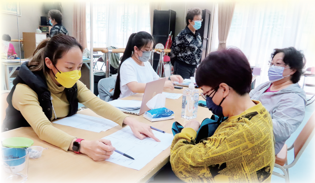
本會職員協助派發支票